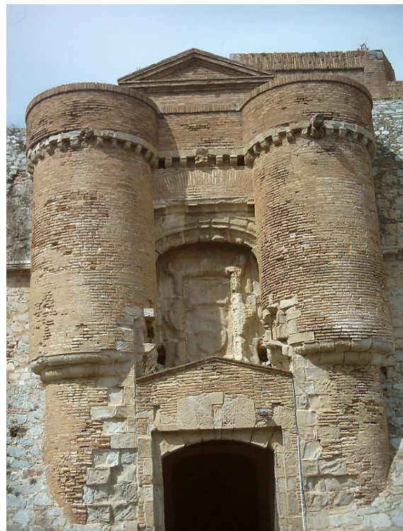
Puerta de acceso al castillo de Salses.

Las obras finalizaron en 1505, pero durante el reinado de Carlos V , en que se convirtió en un punto clave en los constantes enfrentamientos militares con Francia , se le dotó de nuevas e importantes defensas.