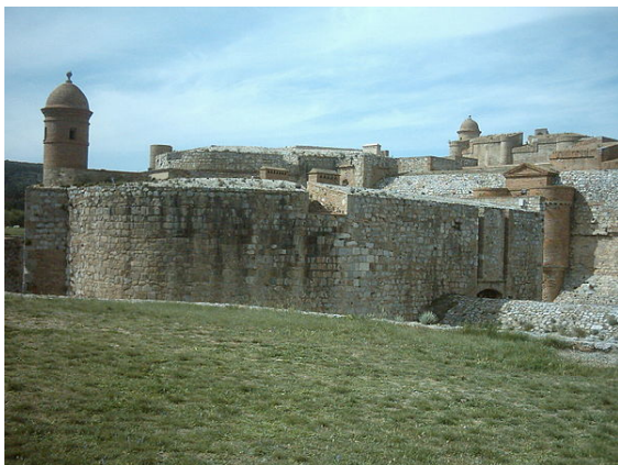
Castillo de Salses.

Es mencionado por primera vez en un documento del año 1047, perteneciendo por entonces a los condes del Rosellón . Pero Alfonso I de Aragón , que había heredado el condado del Rosellón y, por tanto, el castillo de Salses, encargó al abad de La Grassa (o Lagrasse ) la fundación, en el lugar ocupado por la antigua villa de Salses, de un nuevo pueblo, al que concedería franquicias y privilegios.