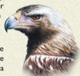
Águila imperial ibérica Aquila adalberti