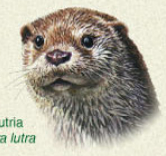
Nutria Lutra lutra