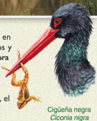
Cigüeña negra Ciconia nigra

Para conocer los importantes valores naturales y culturales que atesora este espacio se han señalado y adecuado para su tránsito las rutas recogidas en este folleto. El visitante, a través de ellas, puede recorrer en diferentes etapas buena parte del territorio de este Espacio Natural y conocer sus municipios.